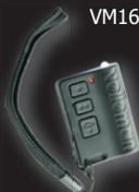
VM166T: 2-kanaalszender met LED-verlichting