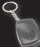
VM130T: 2-kanaals RF-afstandsbediening