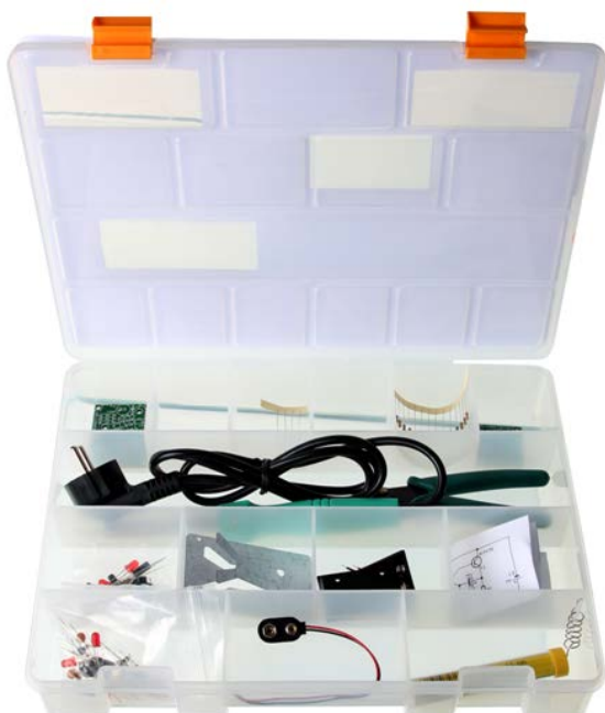
Coffret de rangement pratique